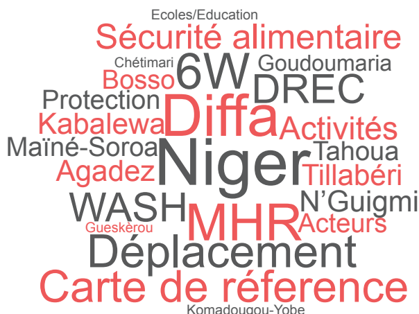
Mots clés des cartes produites