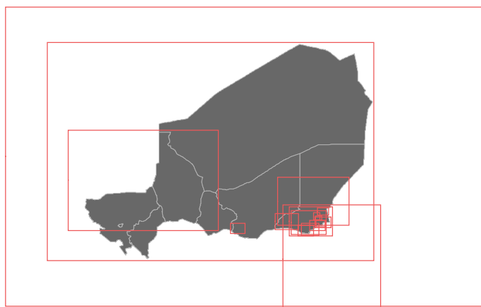
Couverture géographique des cartes produites